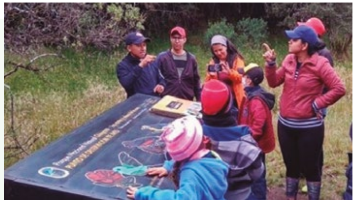
Medidas de inclusión social en Áreas Protegidas de Chile.